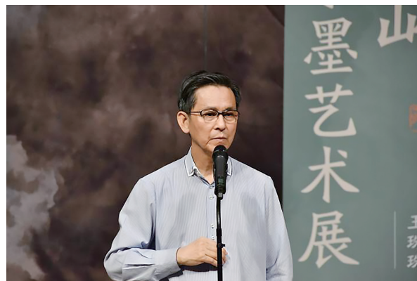
中国美术家协会副主席何家英在开幕式上讲话