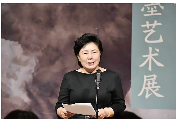
新乡市人民政府副市长李瑞霞在开幕式上深情说道