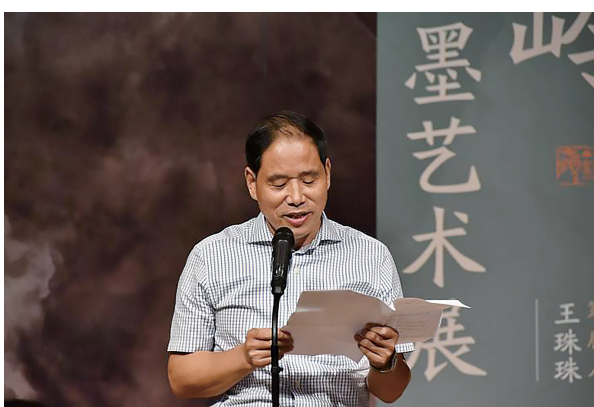
陕西省文联党组书记吴丰宽在开幕式上致辞