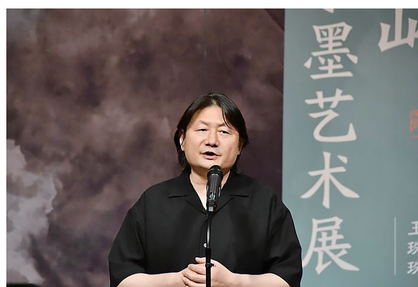
西安美术学院院长朱尽晖在开幕式上致辞