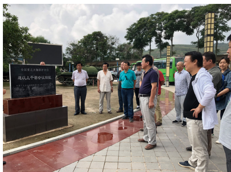
参观“榜罗镇会议纪念馆”