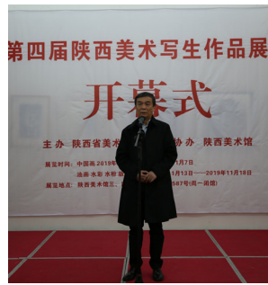
陕西省美术家协会主席 郭线庐