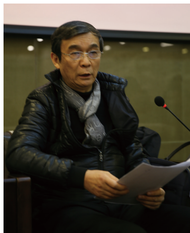
陕西省美术家协会主席 郭线庐